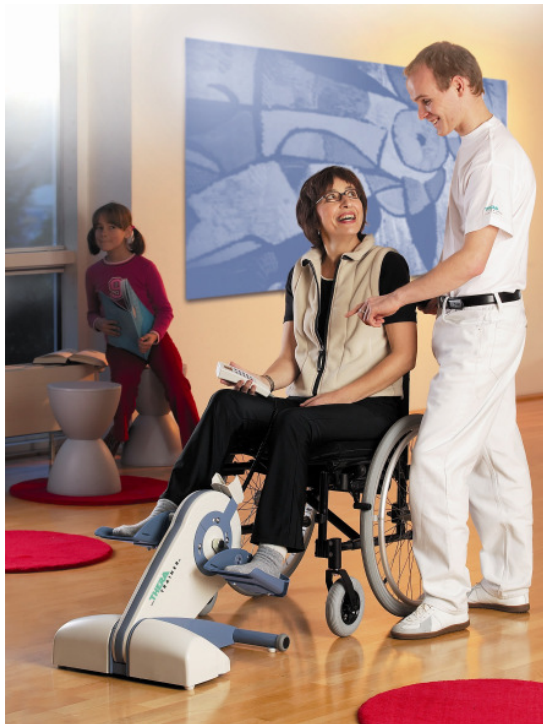
Abb: THERA-live, der ideale Aktiv-Passiv-Trainer für zu Hause

In einer telefonischen Kundenbefragung hat die Firma medica - Spezialist für therapeutische Bewegungstherapiegeräte - seine Kunden gebeten, den 2004 neu eingeführten Bewegungstrainer THERA-live nach Schulnoten zu bewerten. Voraussetzung war, dass die Betroffenen das THERA-live schon mindestens 6 Monate benutzen.