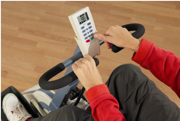
Abb: Einfache THERA-live Bedienung über START- und STOP-Tasten

Was sicher zu den guten Ergebnissen der medica-Kundenbefragung beiträgt, ist die Tatsache, dass Interessenten die THERA-live Bewegungstrainer kostenlos zu Hause testen können. Bevor also eine Kostenübernahme beim Kostenträger beantragt wird, hat der zukünftige Benutzer schon viele Stunden am THERA-live trainiert.