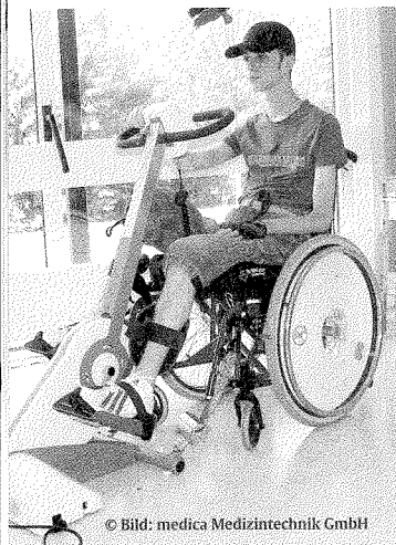
Wirkungsvoll und effizient: Die Restorative Therapie mit dem RT300-S hilft neue Ziele zu erreichen.

Die 1990 gegründete medica Medizintechnik GmbH hat sich auf die Entwicklung und den Vertrieb von therapeutischen Bewegungstrainern und dynamischen Stehtrainern für geh- und bewegungsbehinderte Menschen spezialisiert. Aufgrund höchster Sicherheitsstandards, ausgezeichneter Qualität und bester Bedienerfreundlichkeit zählt die Firma medica mittlerweile zu den führenden Herstellern in diesem Sektor. ■