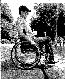
Den Alltag bewältigen Rollstuhl- Fahrtraining, Teil 1