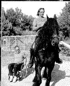
Sport, Spaß & Action Training mit Pferd