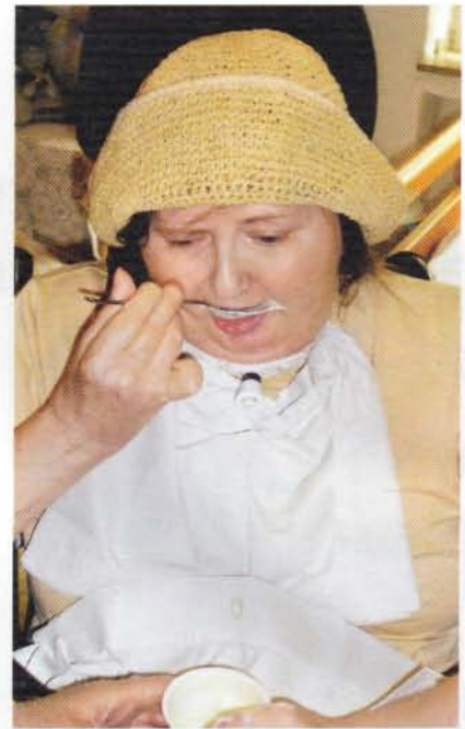
Abb. 3a und 3b zeigen die Kombi- nation von Logo- pädie und Ergothe- rapie

ganzheitlicher Blick für den Patienten verloren geht. Der Physiotherapeut mit seinem Wissen über Handling und Therapie nach 24-Stunden-Konzepten, wie zum Beispiel dem Bobath-Konzept, und die Ergotherapeutin mit ihren Kompetenzen in der Therapie von Störungen in den ADLs (activities of daily living) leisten einen wichtigen Beitrag zur Therapie (Abb. 3a u. 3b).