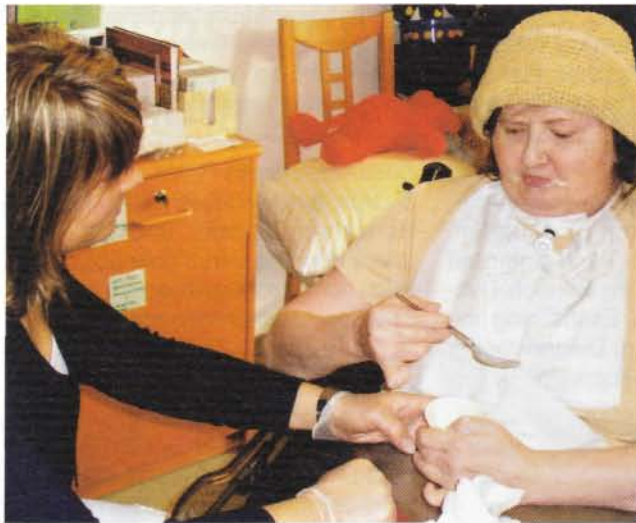
3a (links): Schlucktraining und gleichzeitiges Training der ADLs.