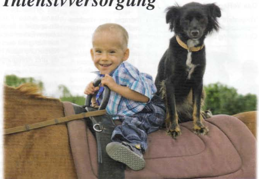
Abb. 1a: Tiergestützte Therapie ist ein wichtiger Bestandteil des VeRegO-Konzeptes

Die Notwendigkeit, Änderungen in den therapeutischen Strategien zu bewirken, führte zur Entwicklung des VeRegO-Konzeptes. Als ganzheitliches transdisziplinäres Konzept bietet es effiziente und leicht anwendbare Therapieansätze für die Arbeit mit schwerst neurologisch geschädigten Patienten auf dem Weg von der Intensivstation bis zur Rückkehr ins häusliche Umfeld – auch unter außerklinisch-intensivmedizinischen