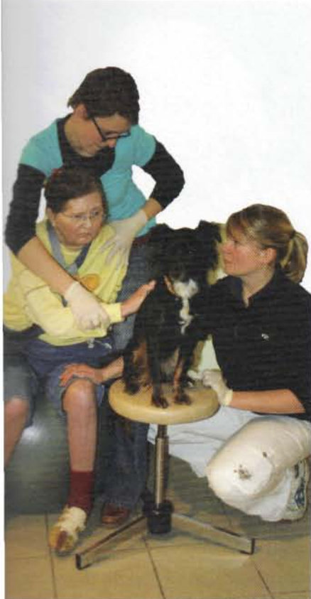
Abb. 1b: Mit Tieren einen Zugang zum Patienten finden

voneinander lernen und Wissen und Fertigkeiten aus anderen Professionen in ihr therapeutisches Handeln einfließen lassen (Abb. 2).