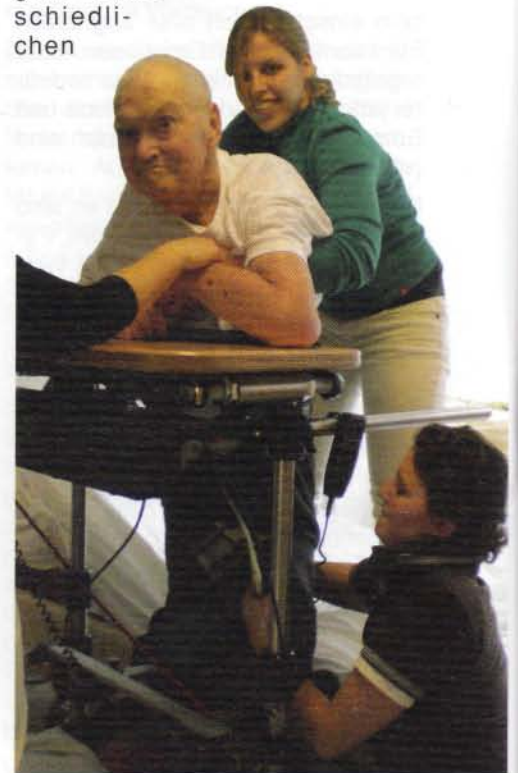
Abb. 4: Vertikalisierung im Balance-trainer trotz hochgradiger Tetraspastik

Regulation bezieht sich im VeRegO-Konzept aber nicht nur auf die Tonusverhältnisse. Vielmehr bedeutet der Begriff die „Normalisierung“ in ganz unterschiedlichen